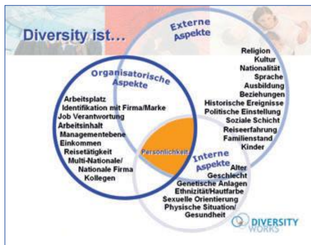
Diversity ist mehr als nur ein Lippenbekenntnis. (Grafik: Diversity Works)

Denn nur dort, wo Menschen ihre Ideen entfalten können, bereit sind, diese zu teilen und ihnen zugehört wird, sind Neuerungen möglich. Wenn Mitarbeiter zufrieden sind, steigt die Produktivität. Und wenn Manager